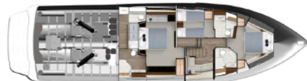
Optional lower lounge with single crew cabin/laundry