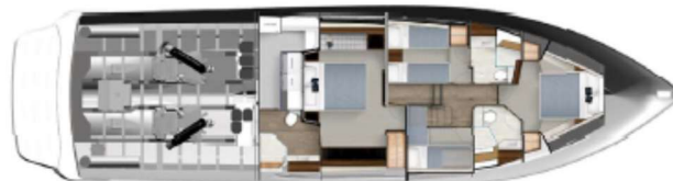
Classic 4 cabin layout with utility/laundry room