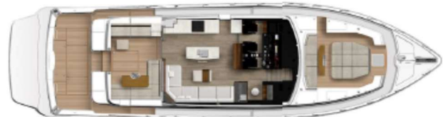
Optional foredeck seating and teak, bait tank in lieu of transom lounge