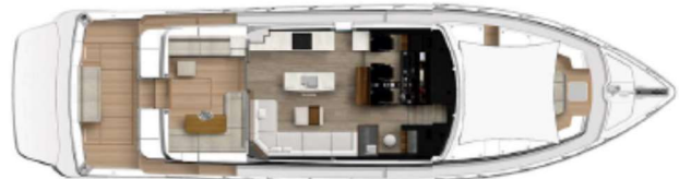
Newport saloon, alfresco and cockpit seating with optional foredeck awning