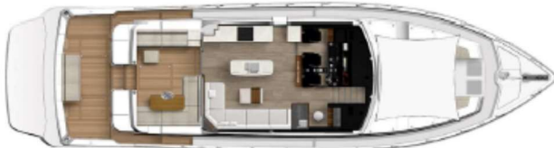
Classic saloon, alfresco and cockpit seating with optional foredeck awning