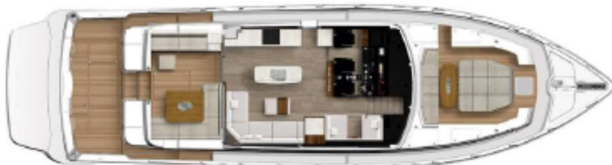
Optional saloon starboard Club Lounge, foredeck seating and teak, bait tank in lieu of transom lounge