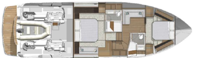
Lower lounge option