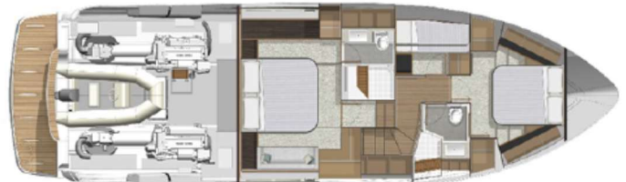
Twin berth port stateroom option