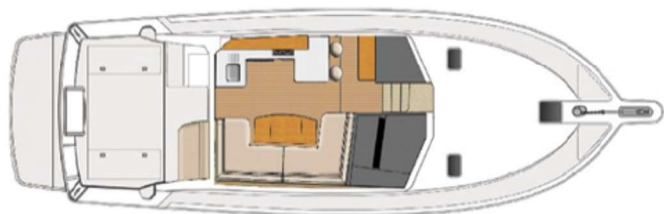
Cockpit barbecue option